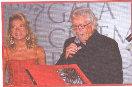
Peppino di Capri e Valeria Della Rocca