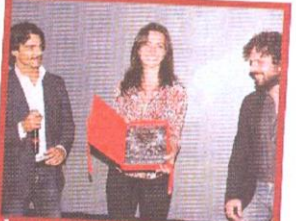
I protagonisti di "Romanzo criminale"