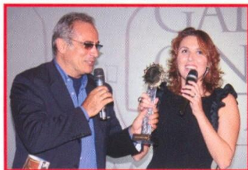
Enzo De Caro e Valeria Mazza